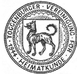
Bisheriges Siegel und langjähriges Logo.

Die Gründung der Vereinigung vor 75 Jahren gehört in eine ganze Reihe historisch-heimatkundlich orientierter Initiativen aus dem Toggenburg. So findet sich im Toggenburger Museum der Ursprung solcher Bestrebungen. Der kulturelle Wandel und nicht zuletzt die moderne Drucktechnik ermöglichten sodann die Herausgabe von verschiedenen, teilweise auch lokal fokussierten Schriftenreihen und Chroniken. Jüngster Spross ist das «Toggenburger Jahrbuch», das personell und ideell eng mit der Toggenburger Vereinigung für Heimatkunde verbunden ist.