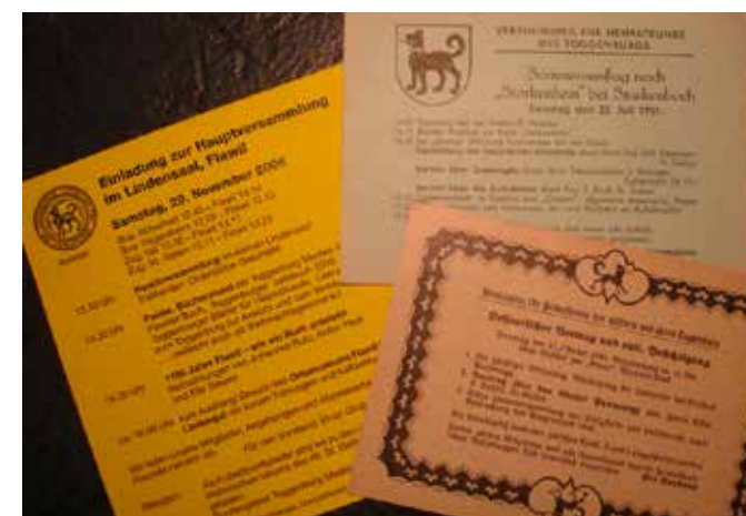
Einladungen der Vereinigung für Heimatkunde des mittleren und oberen Toggenburgs, ab 1951 Vereinigung für Heimatkunde des Toggenburgs, ab 1952 Toggenburger Vereinigung für Heimatkunde. Archiv TVH.