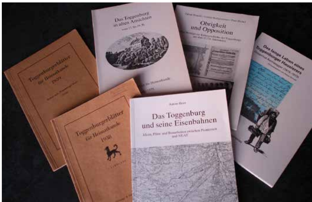
«Toggenburger Blätter für Heimatkunde» im Wandel, ab 1938 bis heute. Archiv TVH.